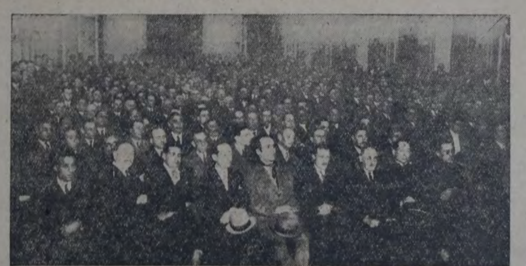
ASPECTO QUE PRESENTABA EL SALON DEL AUGUSTEO

En el salón Augusteo, ante numerosa concurrencia, tuvo lugar ayer la asamblea convocada por la Liga nacional de empleados públicos, a objeto de considerar la situación planteada por la caja de jubilaciones y por la ley de emergencia. El doctor Amadeo, presidente de la Liga, pronunció un extenso discurso, que fué estruendosamente aplaudido. Dijo que la situación porque atraviesa la caja de jubilaciones, es consecuencia de irregularidades y del incumplimiento del gobierno en el pago de la deuda, lo que perjudica enormemente a los jubilados. Después de referir otros aspectos del asunto y de hacer resaltar la pésima gestión financiera de la caja y del gobierno, el doctor Amadeo manifestó que todo se puede corregir con la aprobación del proyecto que el año anterior presentó al congreso la Liga de empleados. En el respecto dijo que, para mejor beneficio, es necesario el aporte no sólo del gobierno, sino también del gobierno, como lo establece la ley de subsidios y retiro para los militares. Hablando de la composición del directorio de la caja, manifestó que en él deben tener cabida representantes de los empleados, lo que no es ni más ni menos que colocar a la caja en la misma situación que las otras.