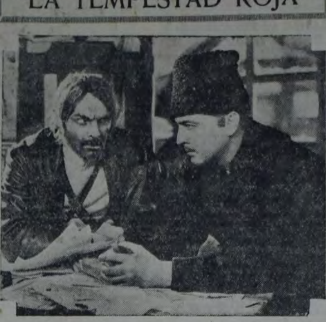
JOHN BARRYMORE EN UNA ESCENA DE "LA TEMPESTAD ROJA", PEQUEÑA QUE "ARTISTAS UNIDOS" ESTRENARÁ EL MIÉRCOLES PRÓXIMO.